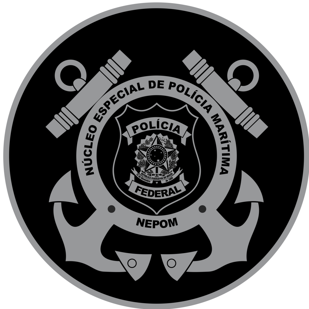
Emblema do NEPOM